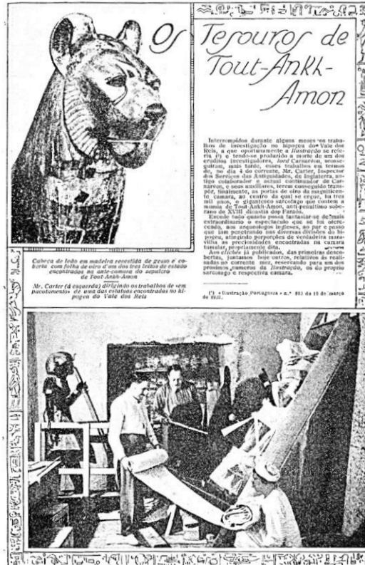
Figura 4: Ilustração Portuguesa (19.02.1924).