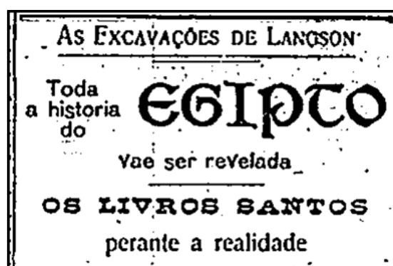
Figura 3: A Capital (30.01.1923).