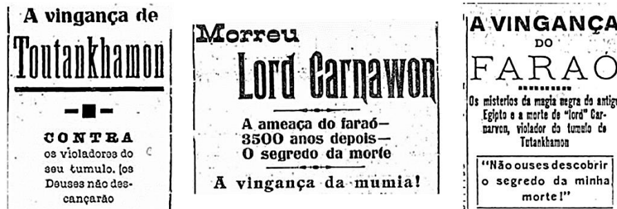
Figura 5: A Capital (11.02.1924); A Capital (05.04.1923); Diário de Notícias (07.04.1923).

A atenção que foi dada a estas questões revela uma perspectiva que olhava para as descobertas no antigo Egito como propiciadoras de conhecimento histórico, principalmente na sua relação com a história bíblica 26 ; valorizava