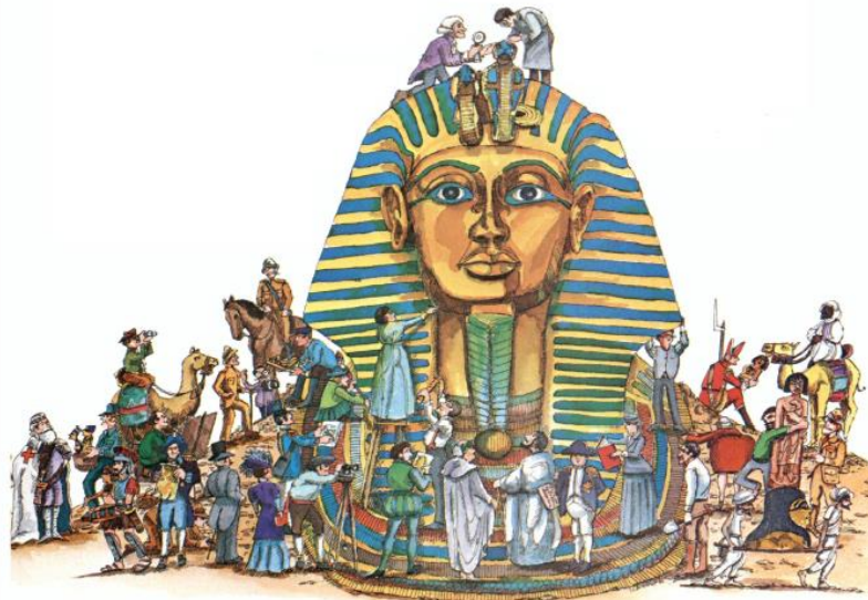
Figura 1: Representação alegórica do interesse em torno do faraó Tutankhamon (Holt, 1986: 61).

As múmias são um tópico do fascínio gerado pelo Egito antigo, desde o século XVIII até à actualidade, onde, por vezes, se mesclam a curiosidade mórbida e a científica e o apelo dos talismãs, amuletos e efeitos miraculosos, com dignas representações em gabinetes de colecionadores públicos e privados, da Europa e das Américas, e, em consequência, um testemunho do interesse pela história das civilizações antigas, pela reinterpretação e reinvenção do Egito no Ocidente.