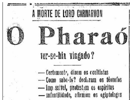
A Capital (05 Abril 1923, p.1) & A Capital (10 Abril 1923, p.2)