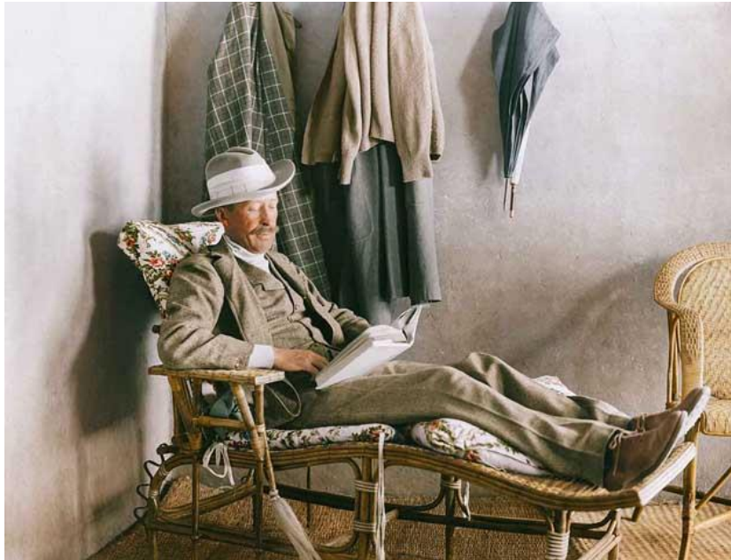
Herbert George Edward Stanhope Molyneux, 5º Conde de Carnarvon, lendo na varanda do 'Castelo Carter', casa de Carter em Elwat el-Dibbân em Tebas