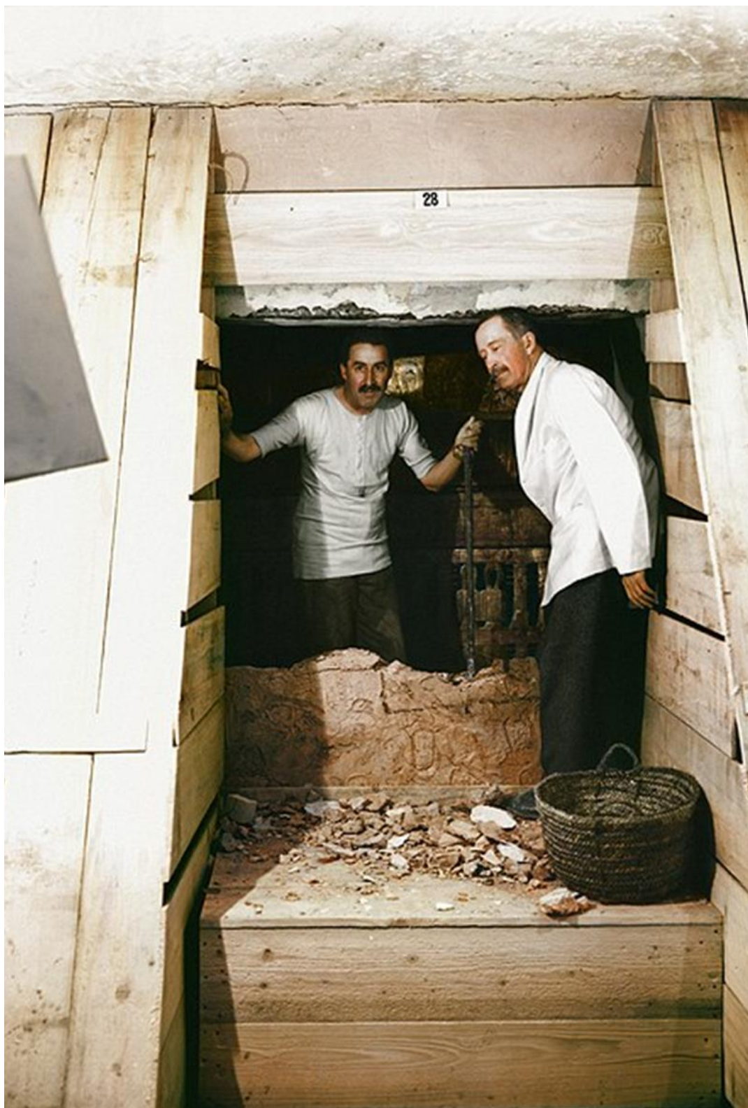
16 Fevereiro 1923. Antecâmara/ Câmara funerária do túmulo de Tutankhamon. Howard Carter e Lord Carnarvon desmantelam a parede entaipada. Uma das duas fotos em que os dois parceiros aparecem no interior do túmulo.