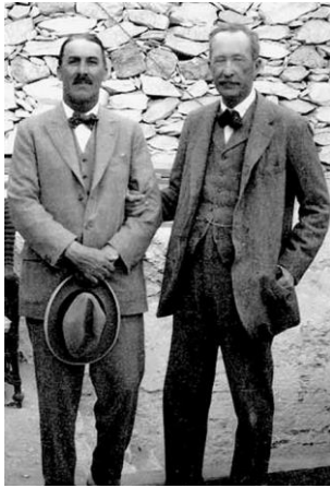
Howard Carte e Lord Carnarvon (Vale dos Reis – 1923)