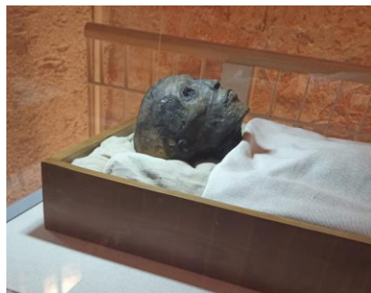
Múmia do faraó Tutankhamon (KV 62 – Vale dos Reis – Abril.2022)

Até lá, mantenha-se a par consultando o nosso site e seguindo a nossa página no Facebook.